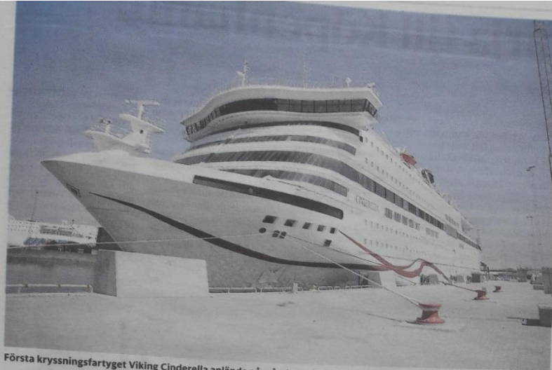
Första kryssningsfartyget Viking Cinderella anlände på måndagen till Ystad.