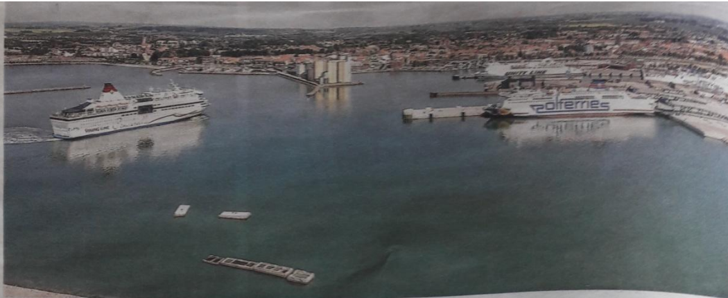
Viking lines kryssningsfartyg Cinderella anländer till Ystad.