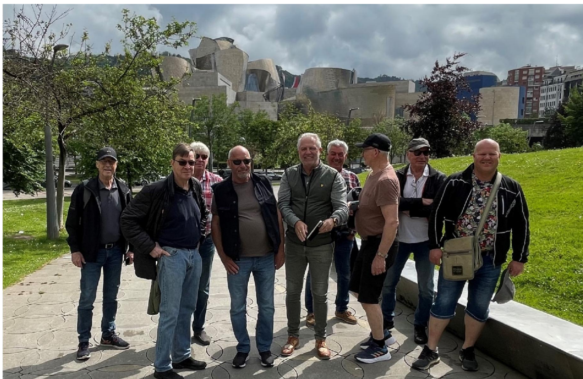
Ett morgonpiggt gäng som trånar efter att få komma in i museet