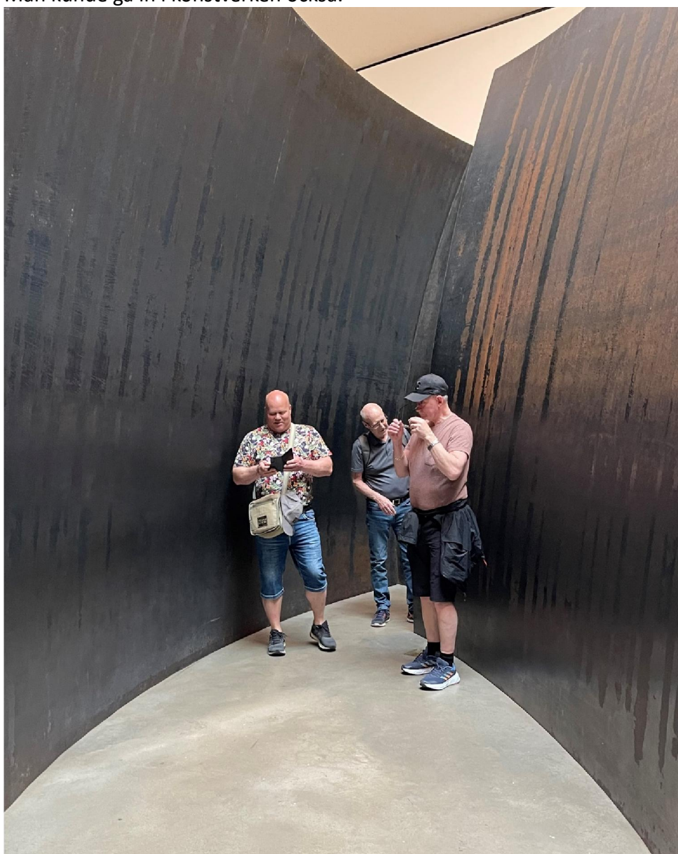
En göteborgare, en stockholmare och en värmlänning var mäktat imponerade