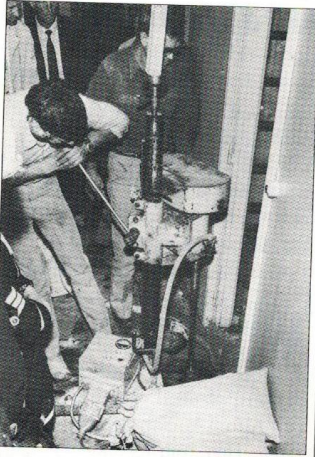
Med en kärnborr gjordes de hål i kundvalvets tak som var nödvändiga för att förse de instängda med mat och dryck och för gasbeläggningen.

erbjöd sig frivilligt och på egen risk att vara med och hjälpa till.