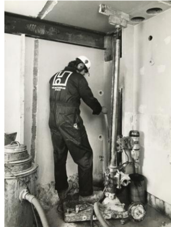
Borrning med Pixi