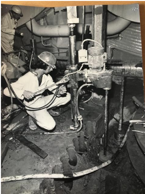
Borring vid Oskarshamns kärnkraftverk