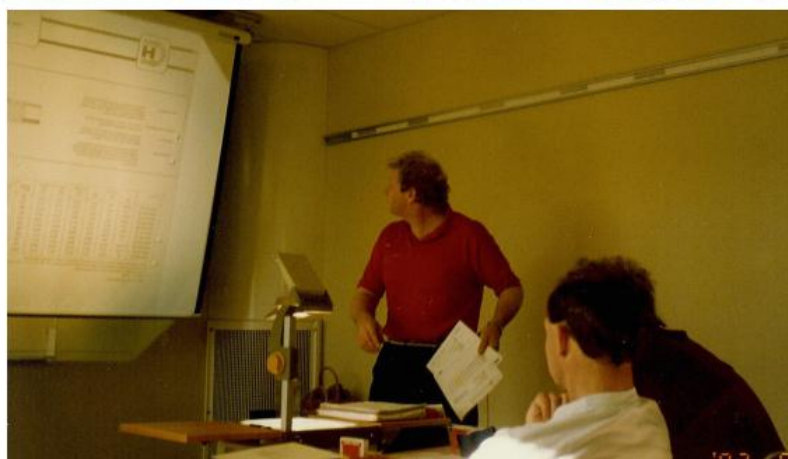
Hib organiserar första kursen som ska leda till yrkesbevis för håltagare, tidigt 90-tal.