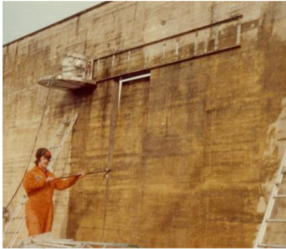
Sågning med Dimas väggsåg VS-10 "Järnhästen" på Hall kriminalvårdsanstalt.