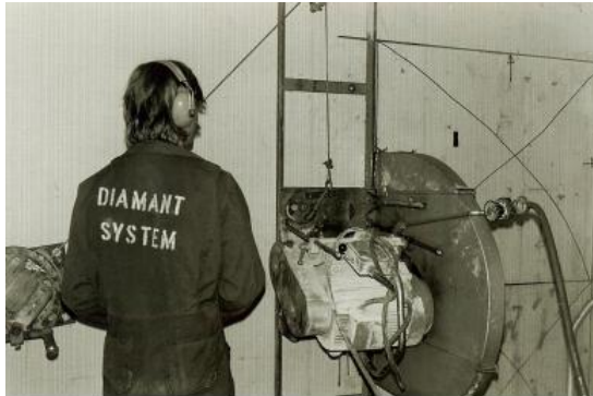
Dimas väggsåg "Järnhästen" i arbete.