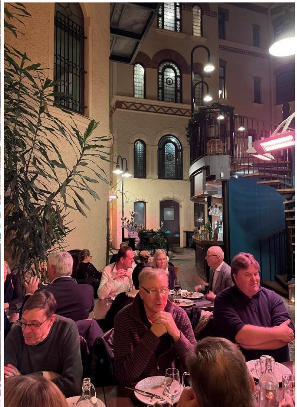
Att alla ser lite röda ut i ansiktet beror inte på konsumtionen utan att vi var omgivna av infravärme.

Ut på isgatorna och tillbaka till Knaust. Samling i baren och "The same procedure that last year", d.v.s. gamla minnen om jobb, kamrater och om oss själva. Och naturligtvis måste vi leva upp till träpatronernas dryckesvanor, lättgrogg eller "det går lika bra med Coca Cola".