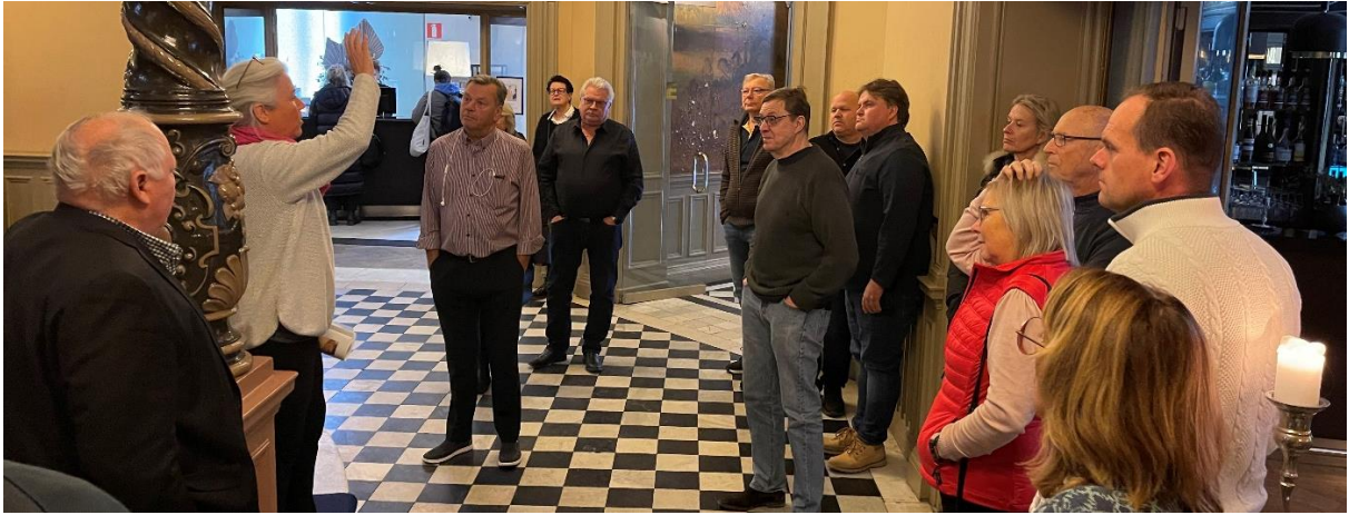
Vår guide i lobbyn på Knaust