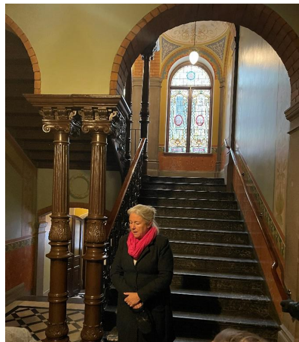
Bernska huset uppfördes 1894. Det är fortfarande det pampigaste huset i Sundsvall