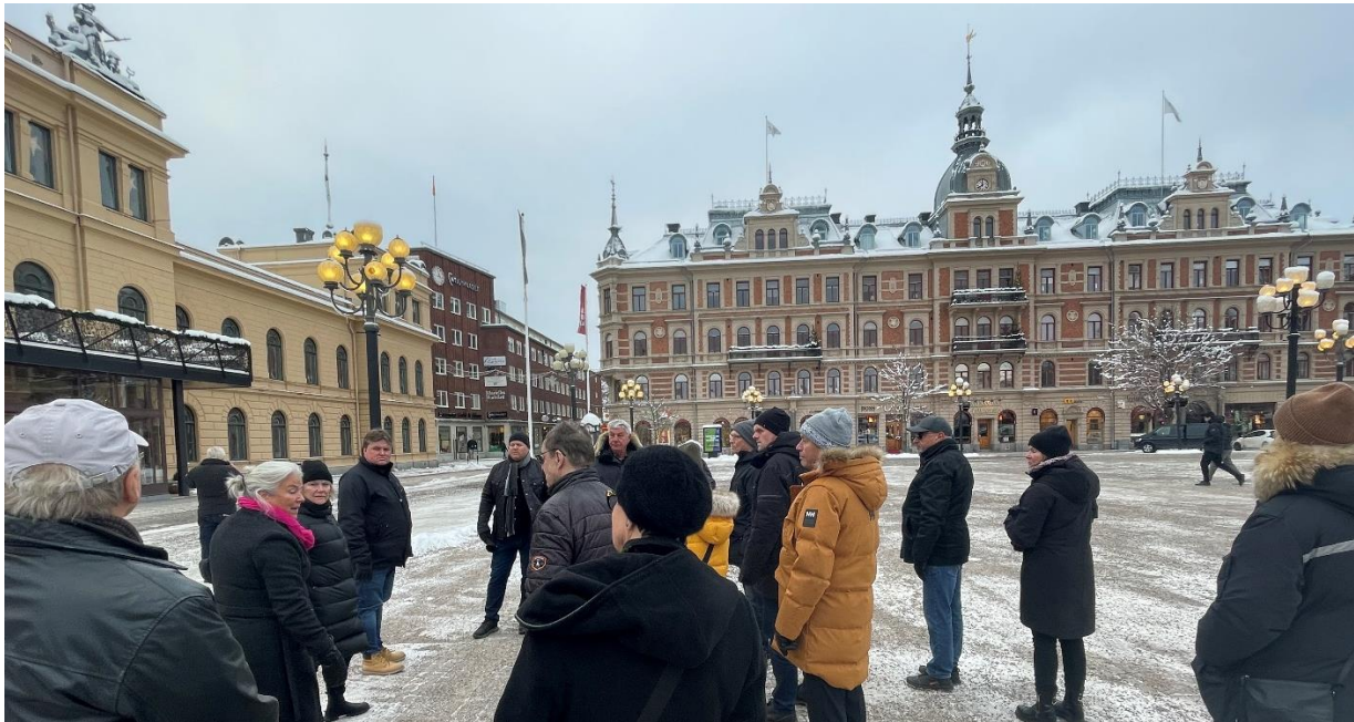
Torget med stadshuset till vänster. Stadshuset har ibland tagits för järnvägsstationen (p.g.a. utseendet). Rakt fram syns ett av huset som uppfördes efter den stora branden 1888. Från början var det bostäder i dag är det hotell.

Efter en stärkande lunch på en av stadens bättre restauranger, var det dags för årsmötet. Damerna släpptes loss på stan och vi veteraner samlades för årsmötet.